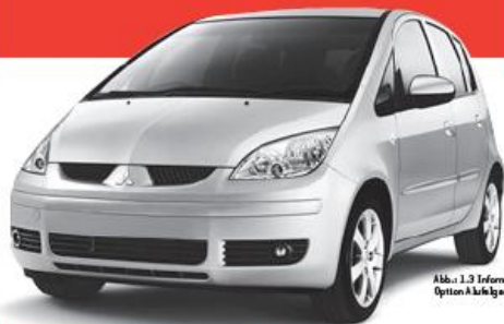
Abbr. 1.3 Inform Option A klickigen